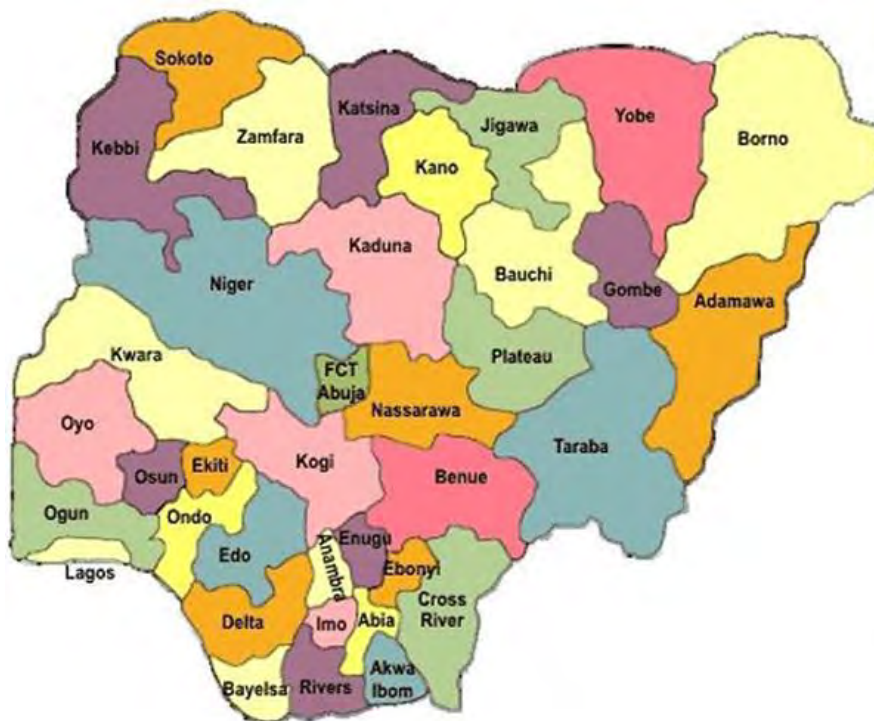
Nigeria: Mapa con los 36 Estados y el Territorio de la Capital Federal

El idioma oficial es el inglés aunque en el día a día se escucha el “pidgin english”, que es una mezcla de inglés y de palabras de lenguas vernáculas. Existen alrededor de 400 lenguas y dialectos de los cuales los principales son el Yoruba, hablado en el sudoeste, el Igbo, en el sudeste y el Hausa en el norte.