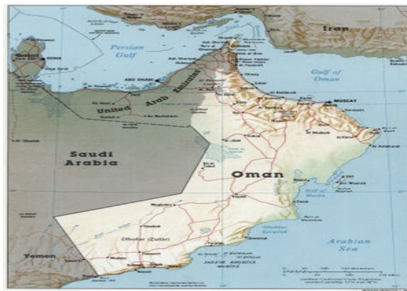
Mapa detallado del Sultanato de Omán

El Sultanato de Omán tiene una superficie de 309.500 km 2 y está situado en la costa sureste de la península Arábiga. El Sultanato de Omán limita al norte con el golfo de Omán, y al este y sur con el mar Arábigo con 3.165 km de litoral; al suroeste con Yemen (288 km), al oeste con Arabia Saudita (676 km), y al noroeste con los Emiratos Árabes Unidos (410 km).